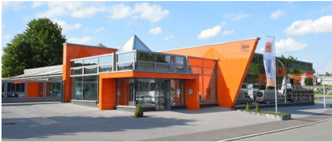
Firmensitz in Schmallenberg