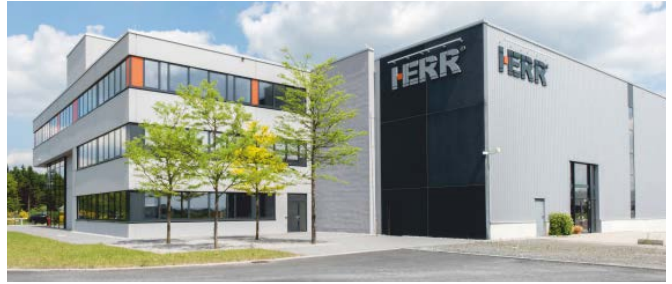
Firma Herr in Haiger/Burbach