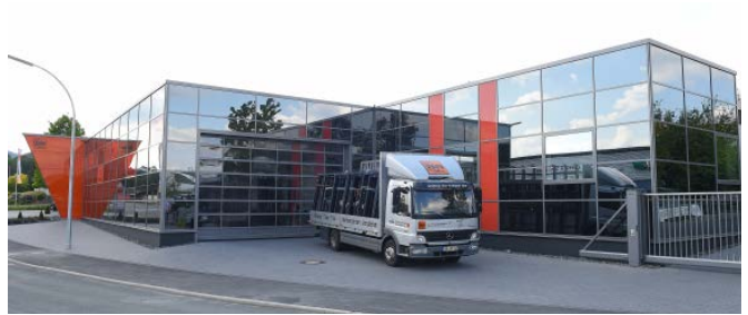
Firmensitz in Schmallenberg