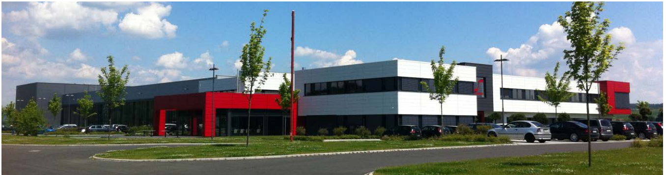
Firma Schneider in Fronhausen bei Marburg