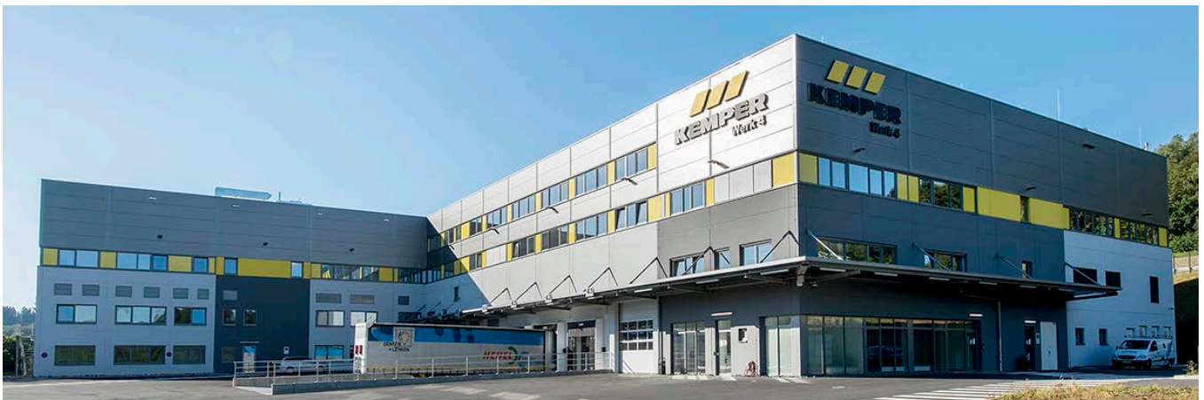
Firma Kemper in Olpe