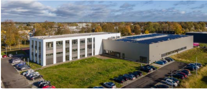
Firma NOFFZ in Tönisvorst